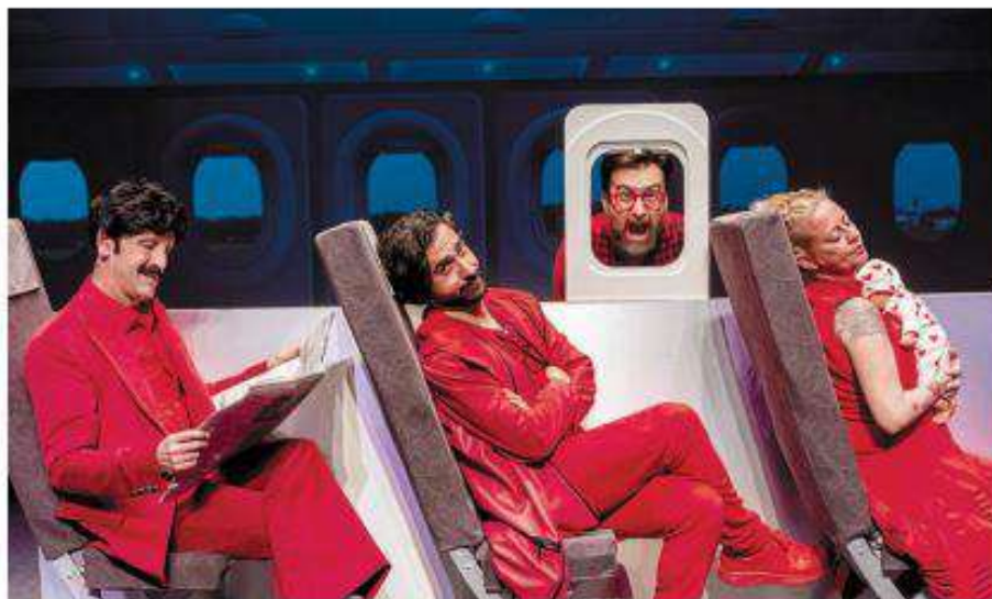
Un momento de la obra Passport , de Yllana, en una imagen promocional.