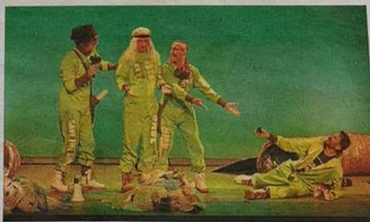
Los cuatro Yllana, en un momento de la obra este viernes en Alfaro.

Divertir y hacer pensar son máximas también de Cómicos. Por ello, la Muestra Nacional de