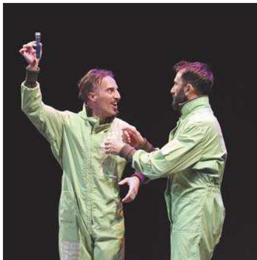
Un momento de la representación en el Gayarre.