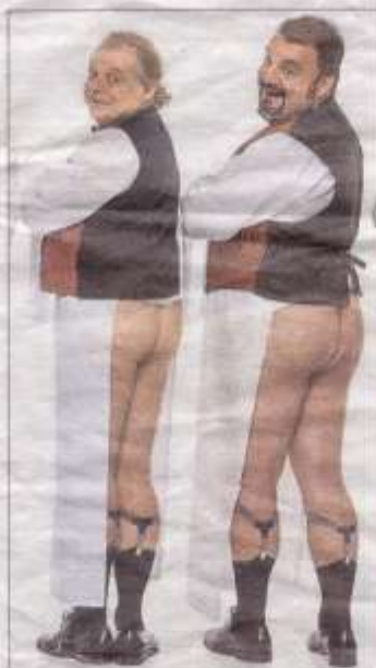
Dos de los actores durante el 'show'.

Fue hace 10 años o más, en el Alfil, Lo mejor de Monty Python . Y quizá por aquella querencia el otro día me planté en el teatro de la calle Pez en vez de ir al Calderón para ver el remake , la reposición o como lo quieran llamar de los nuevos Monty. A fin de cuentas el Alfil es como la sede de Yllana y sitio familiar también de Imprebis. Llegué al Calderón con el tercer aviso gracias a la pericia de un taxista volador. ¡Qué emoción por las calles de Madrid! Mis acompañantes y yo