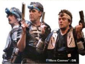
"Yllana Cosmos"

Star Trip revisite les grands thèmes de la science-fiction à coup de références désopilantes. Syndrome priapique post-ibernation, explosion thoracique sanguinolente, attaques de monstres en plastique, téléportations ratées, sorties en apesanteur... tout devient prétexte au délire le plus total ! La folie atteint son paroxysme quand l'équipage entreprend de partir à la chasse au monstre au beau milieu de la salle et de ses spectateurs médusés et hilares. Attention, sortez vos scaphandres ! Il peut arriver que cette chasse initiatique se poursuive dans les couloirs du théâtre ou même dans la rue ! Sans une parole mais à grands renforts d'onomatopées, de musiques qui démenagent, d'effets spé-