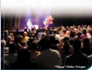
"Yllana" Didier Pallages

Le 1er octobre, la salle Alizé va vibrer de vos rires extatiques. "Yllana", quatre Madrilènes déjantés ouvriront la saison culturelle "Muret en Scène" avec leur spectacle : "Star Trip". Il vous reste quelques jours pour muscler vos zygomatiques, et pour venir retirer vos invitations.